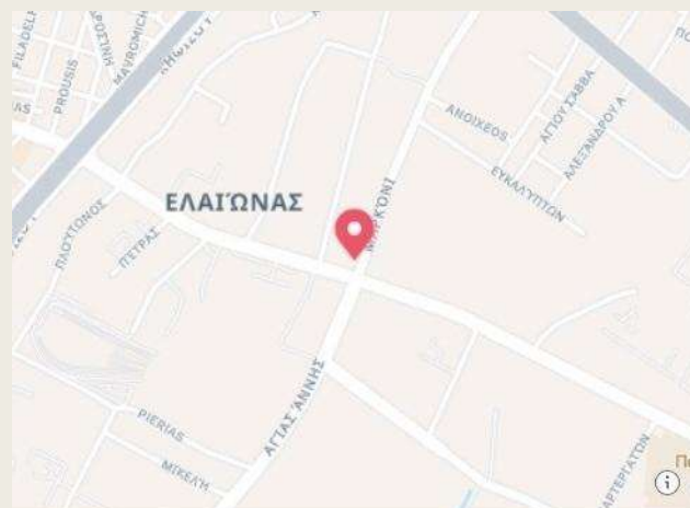
Eleonas metro station Ιερά Οδός, 122 42 Αιγάλεω, Ελλάδα

Τι θα δούμε, τι θα μάθουμε και πού;; Παλιά, σπάνια και κλασικά αυτοκίνητα, εξαρτήματα και βαγόνια ηλεκτρικών τρένων και ιστορικά ή πολεμικά πλοία, στην Αθήνα, στον Πειραιά και στο Φάληρο (Μαρίνα Φλοίσβου), και τέλος βιομηχανική αρχαιολογία και εγκαταστάσεις φωταερίου στο Γκάζι.