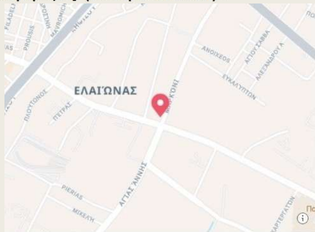
Eleonas metro station Ιερά Οδός, 122 42 Αιγάλεω, Ελλάδα