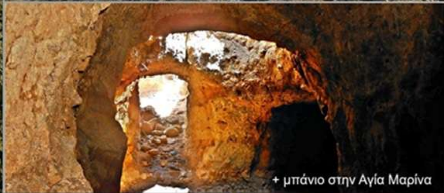
+ μπάνιο στην Αγία Μαρίνα